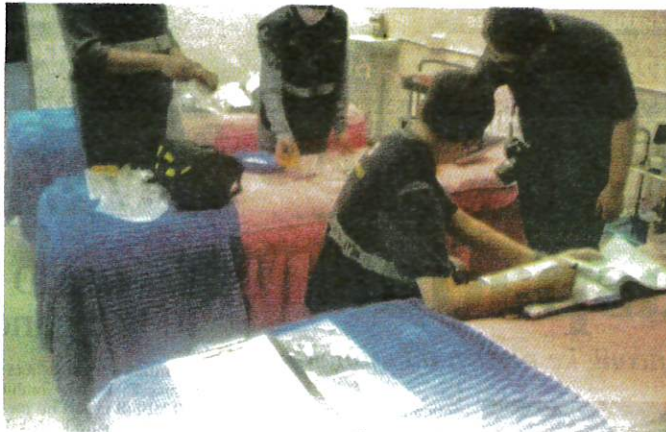
SERBUAN dilakukan pegawai KKM di sebuah butik kecantikan yang menawarkan khidmat veneer gigi.

"Sebagai contoh, pemasangan pendakap gigi (tooth braces) untuk tujuan rawatan ortodontik iaitu rawatan membetulkan kedudukan gigi yang tidak teratur (gigi