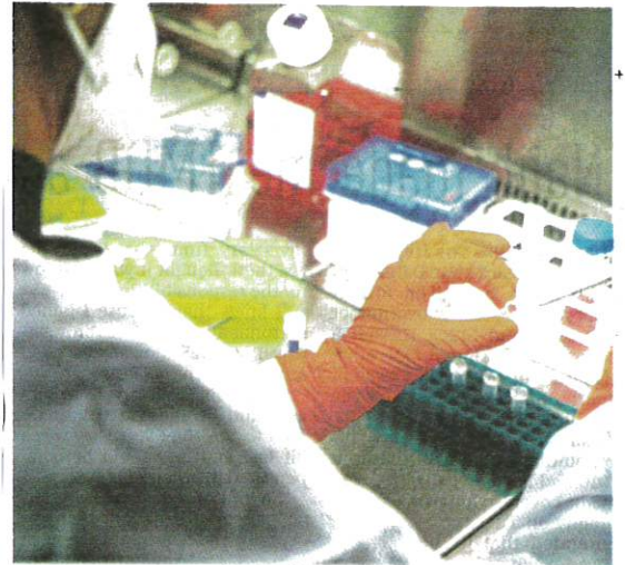
Vaccine company Bavarian Nordic near Munich, Germany, is the only one in the world to have approval for a smallpox vaccine called Jynneos in the US and Imvanex in Europe, which is also effective against monkeypox.

Monkeypox, a zoonotic disease endemic in the animal population in western and central Africa, has been reported in Europe, North America, Australia, United Arab Emirates and Morocco.