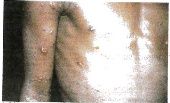
Individu melancong ke luar negara perlu segera mendapatkan rawatan jika mempunyai gejala cacar monyet.